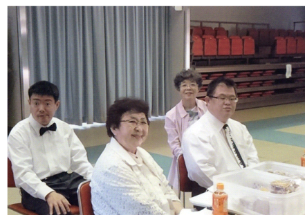
多度 月待ちコンサート